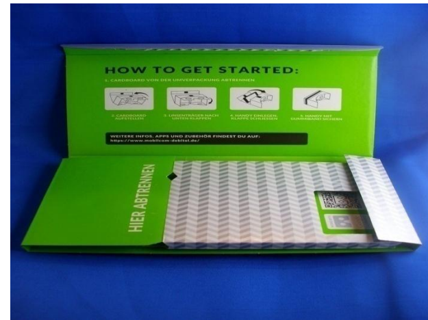
Höhe: 137 mm Tiefe: 17 mm

Hinweis: Es handelt sich hier bei um die Google 3D VR Brille aus Karton bzw. Pappe, die mit Ihrem Logo, Werbung, bedruckt werden können. Einsatzgebiete: Werbeartikel, Werbemittel, Mailing