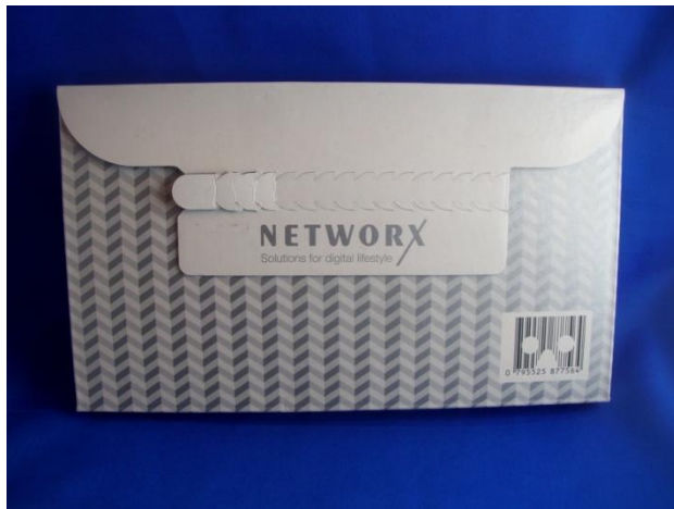
Gewicht: 130 gramm Länge: 235 mm

Eignet sich hervorragend für den Postversand als Großbrief